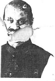
ರಾಜ ಎನ್. ಬೊಮ್ಮಾಯಿ ನ್ಯ ಮುಖ್ಯಮಂತ್ರಿಗಳು